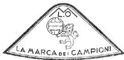
Marchio registrato nel 1947

In aggiunta al già citato Parola altri fuoriclasse del calibro di Angelillo, Antognoni, Tardelli e Scirea furono tra i prestigiosi testimonial dei prodotti da calcio LEONE SPORT. Anche per il fuoriclasse interista, nel 1960, fu depositato il marchio riproposto su diverse sfere accompagnato dalla dicitura "CANNONIERE" che riproponiamo in due differenti versioni, 4 e 5.