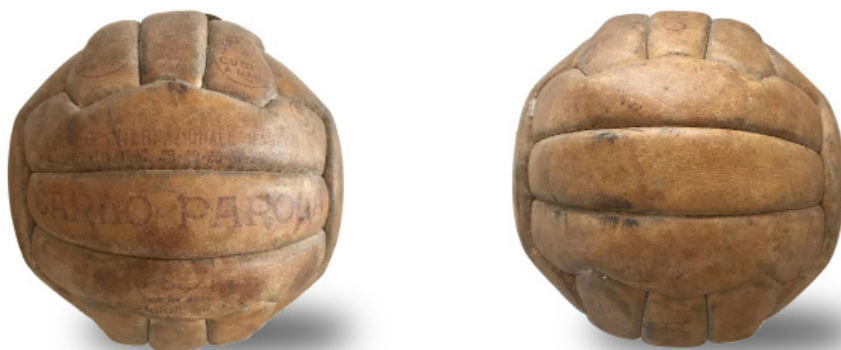
Pallone Carlo Parola 18 sezioni a zig zag Torneo Internazionale Sanremo 1954