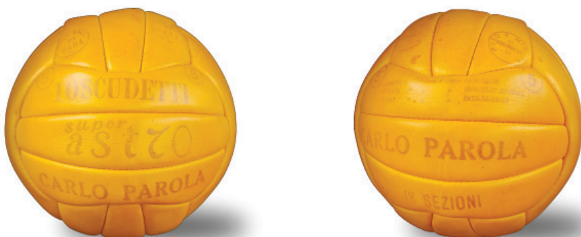
Pallone Carlo Parola modello "Super Astro" 18 sezioni con sezioni differenti rispetto al precedente modello rappresentato, primi anni '60