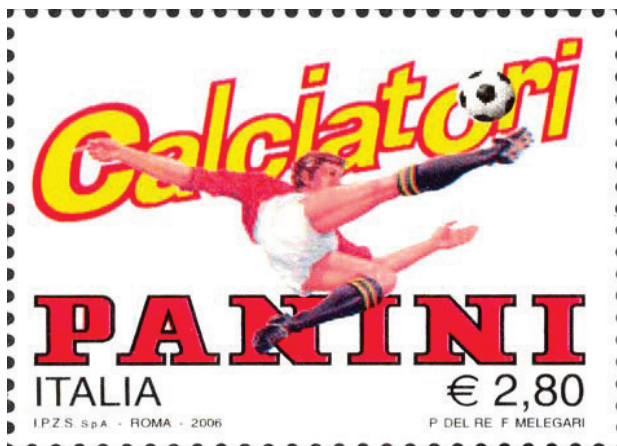
Francobollo emesso il 30/01/2006 che celebra la Panini nel 45° anniversario della prima edizione dell'album dei calciatori

Marchio d'impresa depositato il 28/06/1958