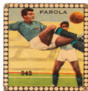
Figurina Carlo Parola ed. Stadio