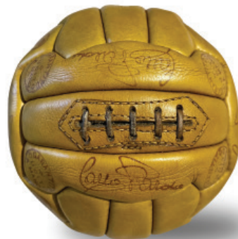
Pallone Carlo Parola modello "Aristos" a 5 passaggi di stringa 18 sezioni fine anni '40