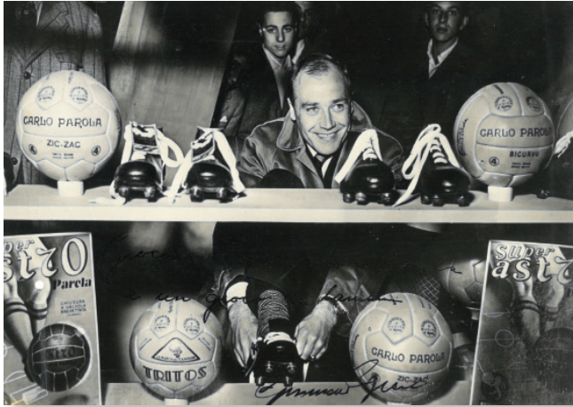
Foto pubblicitaria dei palloni "Carlo Parola" con il giocatore del Milan Gunnar Gren