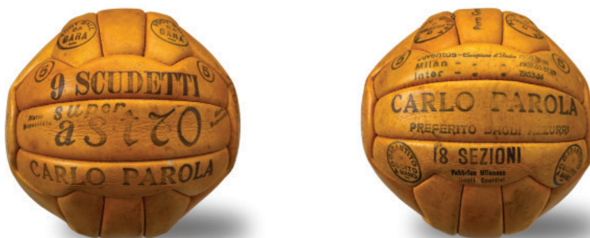
Pallone Carlo Parola modello "Super Astro" 9 scudetti 18 sezioni a zig zag anno 1959